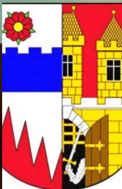
MĚSTSKÁ ČÁST PRAHA 15