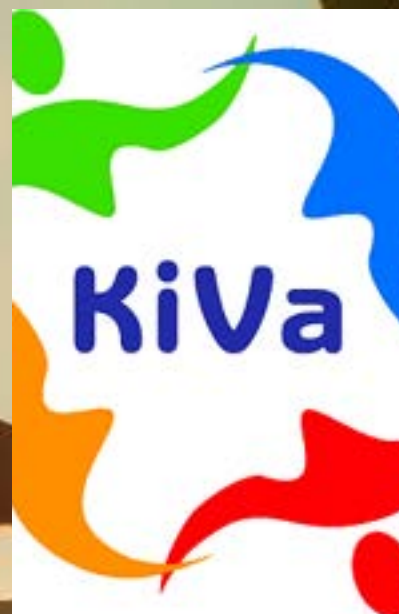
PROJEKT ODYSSEA Z.S.