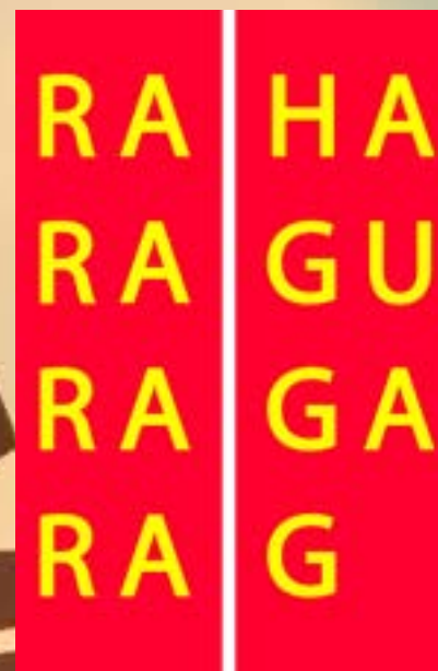
HLAVNÍ MĚSTO PRAHA