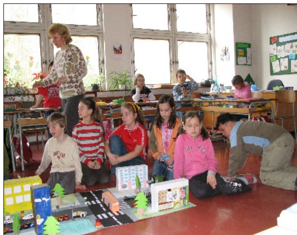
Ulice Tennisová našima očima