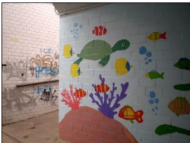
Kontrast sprejeří, děti

Společně strávené chvíle hodnotíme nejen my, ale i zástupci MČ Praha 15, žáci a rodiče, jako velmi zdařilé. Děti přesvědčily dospělé, že jim záleží na prostředí, ve kterém žijí a dokázaly, že právem patříme do škol oceněných mezinárodním titulem Ekoškola.