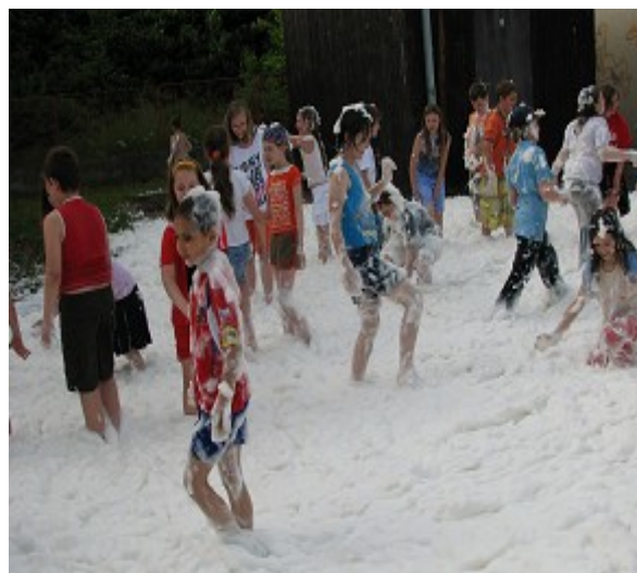
Zkoušíme hasicí pěnu